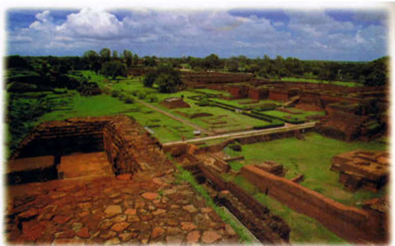
นาลันทามหาวิหาร อุทยานประวัติศาสตร์ : มหาสังฆารามแห่งพุทธศาสนา ห่างจากปาฏลีบุตร (ปัตนะ) ๕๕ ไมล์ พุทธศตวรรษที่ ๖๐ ราชกฤห์ ๗ ไมล์