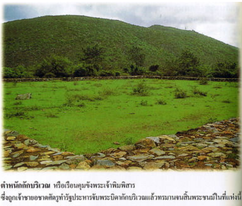
คำหนักกักบริเวณ หรือเรือนคุมขังพระเจ้าพิมพิสาร ซึ่งถูกเจ้าชายอชคัศรุทำรัฐประหารจับพระบิดากักบริเวณแล้วทรมานจนสิ้นพระชนม์ในที่แห่งนี้

คัดตัดตอนจากหนังสือ "สุแดนพระพุทธรองค์ อินเดีย-เนปาล" โดย พระราชรัตนรังษี (ว.ป.วีรยุทธโท)